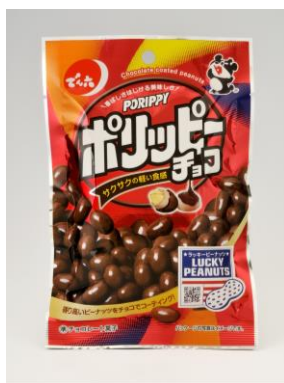
でん六/ 65g ポリッピーチョコ 130円 発売時期:2021年1月