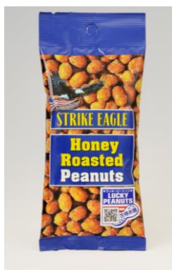
オーバーシーズ/ ストライクイーグル ハニーローストピーナッツ 130円 発売時期:2020年12月