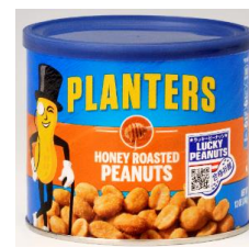
日本ハイツ/ プランターズ ミックスナッツ 850円 プランターズ カクテル ピーナッツ 650円 プランターズ ハニーロースト ピーナッツ 700円 発売時期:2020年11月