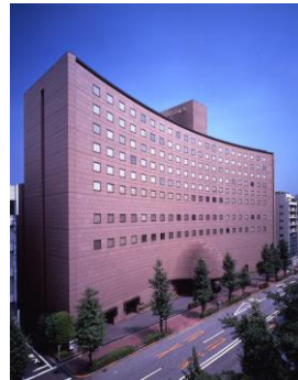
ホテル東京ガーデンパレス