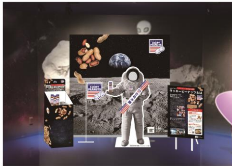
宇宙ミュージアム TeNQ 展示イメージ